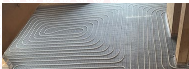
Rohr mit Klettbelegung

* Dämmung bauseits. Alle gängigen Dämmungsaufbauten in Form DEO & DES unter schwimmenden Estrichen aus EPS, XPS, usw. sind möglich.